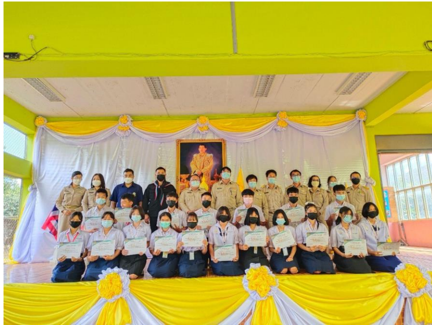
รูปกิจกรรมแสดงความจงรักภักดีต่อชาติ ศาสนา พระมหากษัตริย์