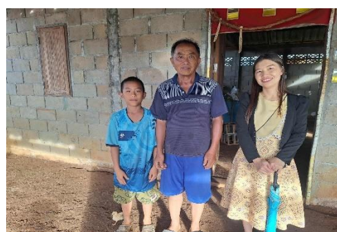
กิจกรรมมอบทุนปัจจัยพื้นฐานนักเรียนยากจน