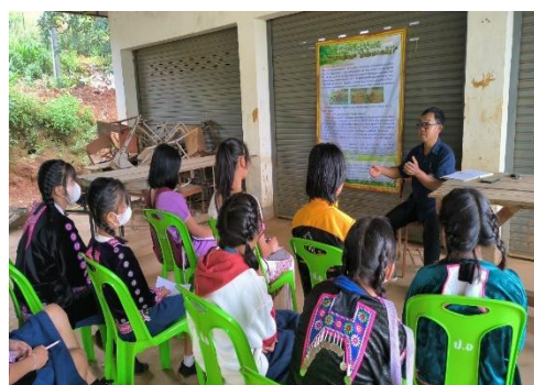
กิจกรรมปราชญ์ชาวบ้านถ่ายทอดทักษะเฉพาะทาง