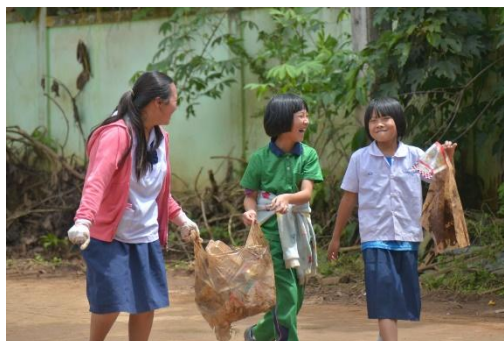
กิจกรรมกำจัดลูกน้ำยุ่งลาย