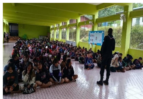
กิจกรรมอบรมคุณธรรม