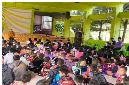
ร่วมกิจกรรมวันสำคัญทางศาสนา