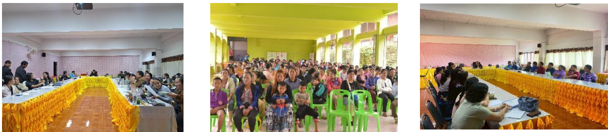
ประชุมวางแผนการดำเนินงานภายในและภายนอก