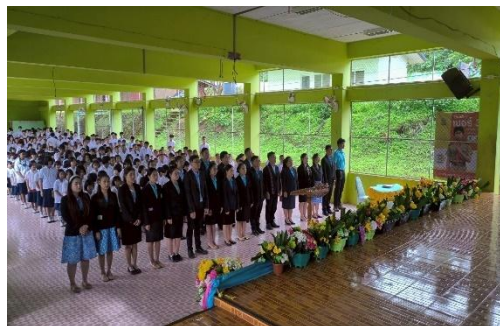
ร่วมกิจกรรมวันสำคัญของชาติและสถาบันพระมหากษัตริย์