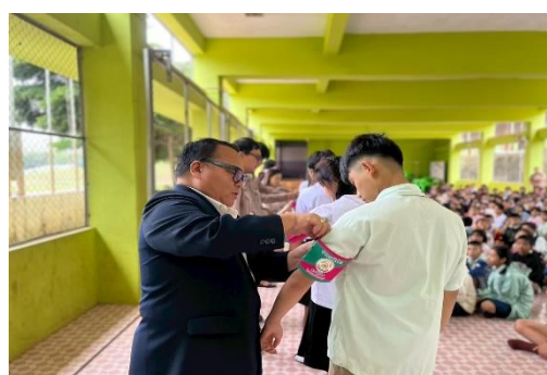
กิจกรรมแต่งตั้งสภานักเรียน