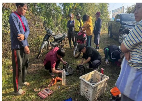
กิจกรรมส่งเสริมทักษะอาชีพ