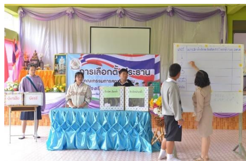
ร่วมกิจกรรมประชาธิปไตย